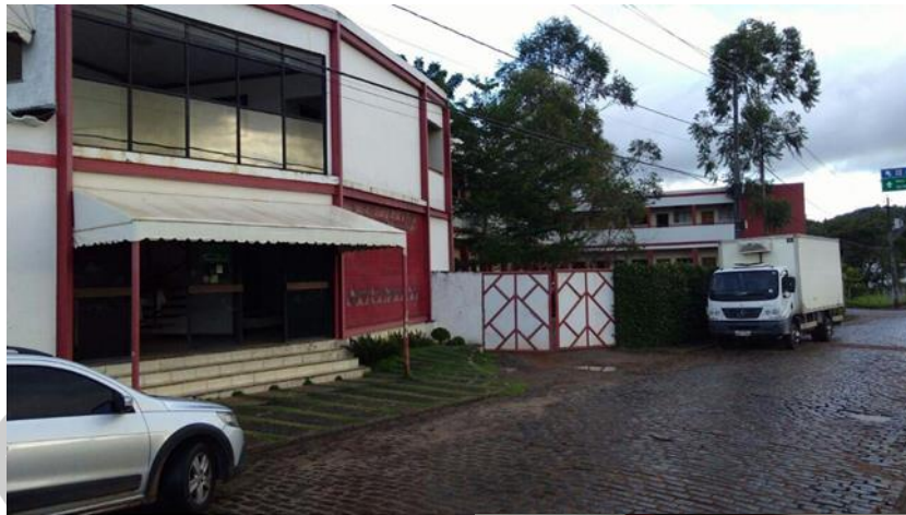
Imagem do Hotel: